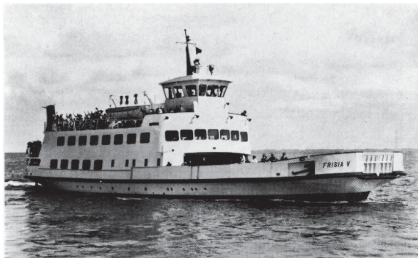
Personen- und Kraftwagenfähre „FRISIA V“ · 867 Personen, 25 Pkw

Durchgehende Züge von Köln und Hannover und die Bundesstraße 70 führen bis zu den Anlegeplätzen der FRISIA-Schiffe , die Sie sicher und bequem zur Insel bringen.